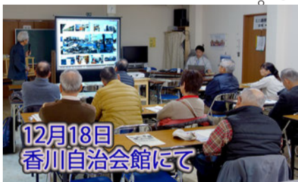
12月18日 香川自治会館にて

●このようなセミナーを地道に続ける事。 ●一人でも多くの人が受講する事。 香川に住む人達には、震災の悲惨な現実と対策を知る良い機会として、積極的に参加を期待したい。 （防災 副部長 中村）