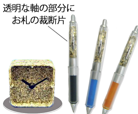
透明な軸の部分にお札の裁断片

●左の写真はボールペンの軸に本物のお札の裁断片が入られて販売されている物です。以前は1万円札50枚分の裁断片で作られた時計も販売されていたようですが今は？