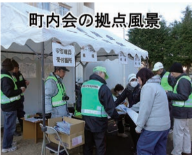
町内会の拠点風景