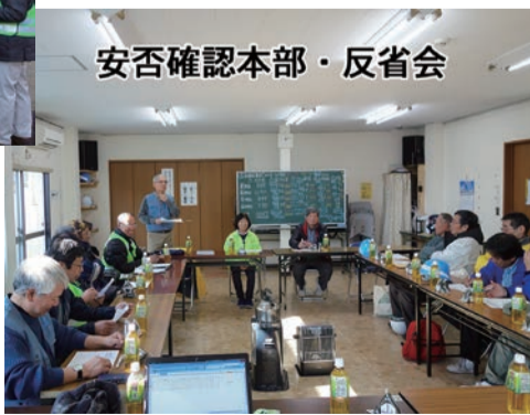
安否確認本部・反省会