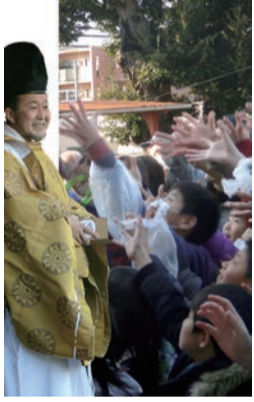
女子・小学生の部スタート

昨年同様、自治会の主導で諏訪神社の協力のもと、実行委員会により豆まきが進められました。昨年の反省から豆まきの開始時間を、小学生の下校時間を考慮して3時45分にしたこともあり、350名と例年になく大勢の親子連れの参加者で賑わいました。