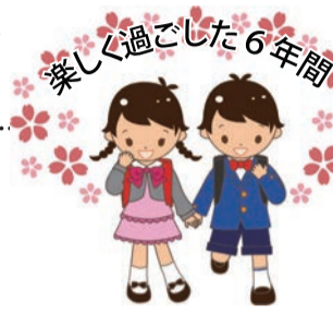
楽しく過ごした6年間