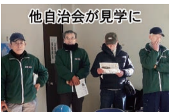
他自治会が見学に来た