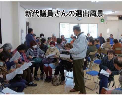
新代議員さんの選出風景