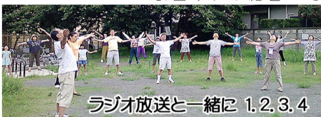
ラジオ放送と一緒に 1.2.3.4