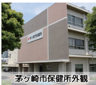
茅ヶ崎市保健所外観

平成29年4月1日 市保健所を拠点として、よりきめ細かく迅速な保健衛生サービスの提供など、市民の健康づくりの総合的な推進が期待されます。茅ヶ崎市から茅ヶ崎保健所に担当窓口が変更になる業務例