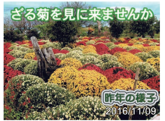
ぎる菊を見に来ませんか

風紋をかけ抜けてゆく素足の子 風紋とあるから砂丘を思い易いが、まだ人の少ない海辺と見てもよい。子供の素足だけが覚えてくる。風紋を消して新しい風が颯とかけ抜けて行くのである。