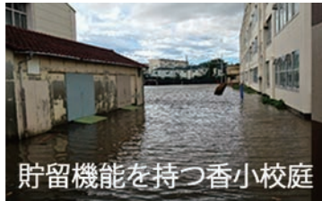
貯留機能を持つ香小校庭

7月下旬から8月にかけて天候が不順で雨の日が多く、お盆過ぎまでずっと暑い日が続きました。会員の皆様におかれましては、いかがお過ごしでしたか。 近隣の住民の方々のご理解と環境部会の努力により、ゴミ集積場が分散され、使いやすくなったと感じています。利用者の皆様には、ゴミの分別や日時などのルールを守って出し方にご協力下さい。 8月13日に町内美化キャンペーンを実施し、駅周辺の草刈り、町内の道路周辺のペットボトル・空き缶等の清掃を行いました。今回は思いの外ゴミなどが少なかったと感じています。今後も、地域の美化にご協力お願いいたします。 香川商興会の街路灯が、劣化や