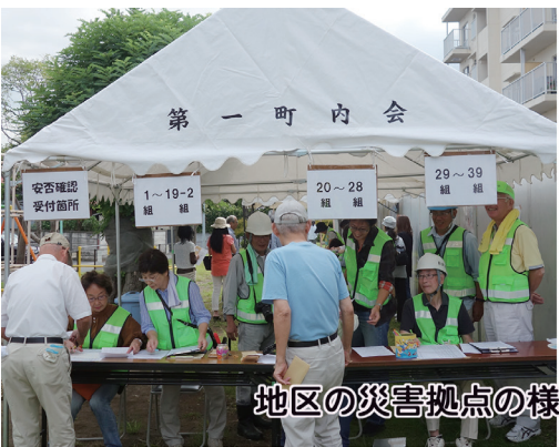
地区の災害拠点の様子