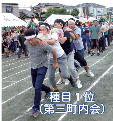
種目1位 (第三町内会)