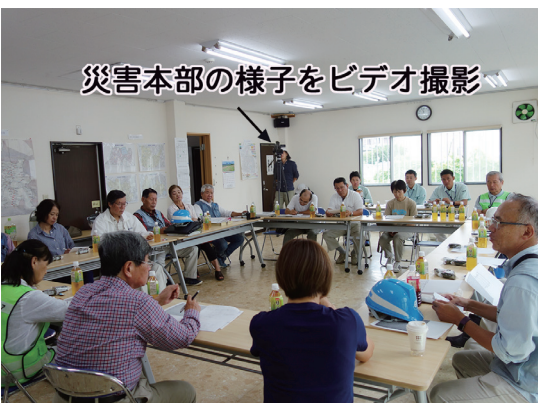
災害本部の様子をビデオ撮影