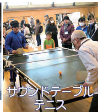
サウンドテーブルテニス

写経終へしあとの浅漬檀那寺 大きな観光寺ではない、檀那寺での小じんまりした写経会である。