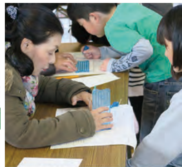
点字体験コーナー