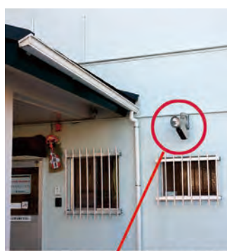
自治会館外壁に設置