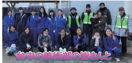
台中の美術部の皆さんと

2月3日の諏訪神社での節分祭には、土曜日の開催ということもあり、子どもさんを始め多くの方々が参加され、盛況に執り行われ