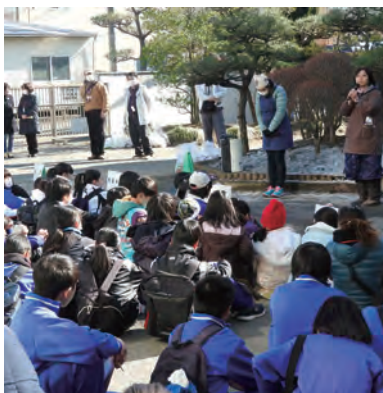
散となりました。(香川小学校区 推進協 田中)