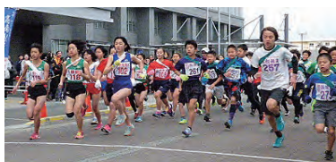
女子・小学生の部スタート