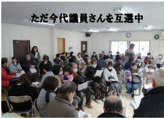
ただ今代議員さんを互選中