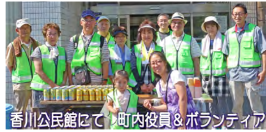
香川公民館にて 町内役員&ボランティア

4月から新しい体制・役員のもとで自治会、町内会がスタートをしました。今後とも町内会活動へのご協力を宜しくお願いします。香川諏訪神社の例大祭が、今年も6月2、3日に盛大に執り行われました。