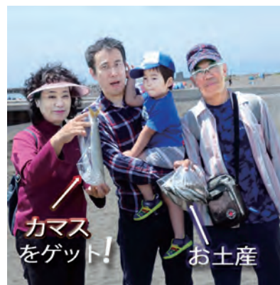
カマスをゲット! お土産

平成30年5月6日に第22回地引網大会をカネサ網さんにて開催しました。参加者は大人217名・子ども110名・大会実行委員28名。網元が変わった昨年は地引網が荒天中止で、レクリエーションのみの開催となりましたので、今年やっとなり実施でき、まずは一安心といった心持でした。 漁獲量としては樽6杯（10センチ前後のイワシ・サバ等）と大きな目はカマス14匹、ワカメ少々でした。過去の記録・記憶と比べれば、皆様へお配りするお土産も控えめな印象となりました。 印象とは反対に、地引やレクリエーションへの熱い参加、誠にありがとうございました。ゲームの景品が足りなくなる様な勢いでした。