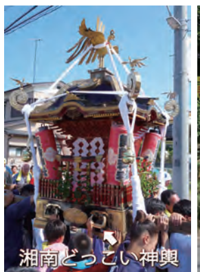
湘南どっこい神輿