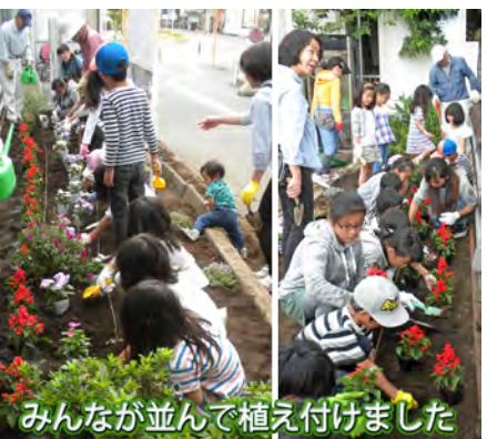
みんなが並んで植え付けました