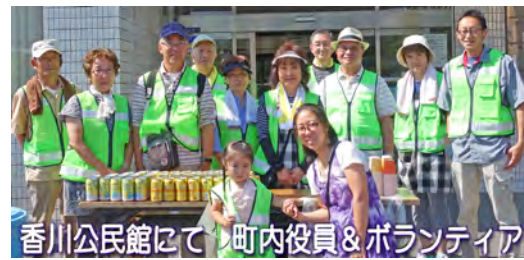
香川公民館にて 町内役員&ボランティア

4月から新しい体制・役員のもとで自治会、町内会がスタートをしました。今後とも町内会活動へのご協力を宜しくお願いします。香川諏訪神社の例大祭が、今年も6月2、3日に盛大に執り行われました。