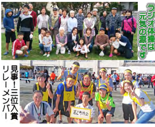
見事！三位入賞 リレーメンバー

秋も一段と深まり、朝晩めっきり寒くなってきました。皆様いかがお過ごしでしょうか。 9月2日の安否確認訓練には、組長さん、会員の皆様、雨の中ご参加いただき、またアンケートに参加、ご意見を頂きありがとうございました。ご意見は今後の訓練の内容検討に反映させていただきます。 10月7日第50回体育大会に参加いただき大変お疲れ様でした。シニアの玉入れ、大縄跳び、ふんころ5、男女混合リレー等、選手の活躍により近年にない成績で総合4位になりました。選手の日焼けした顔が笑顔になり嬉しさが伝わってきました。来年も練習、作戦に力を入れ一つ上を狙いたいと思