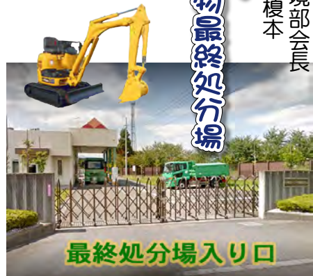
最終処分場入り口

参加者の大半が60歳以上の中、若いお母さんが参加して頂きました。とても有難い事です、これからますます多くの若いお母さんが参加して頂けるように努めたいと考えます。