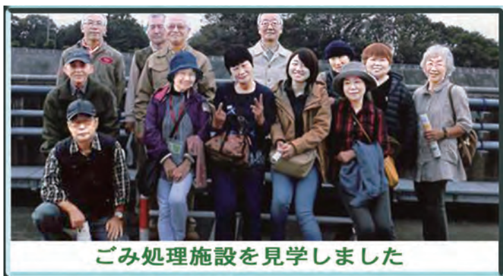
ごみ処理施設を見学しました

1時間半の研修でしたが、「あんしんかん」は老朽化のため、平成31年3月末で閉鎖が決まっているとのこと。