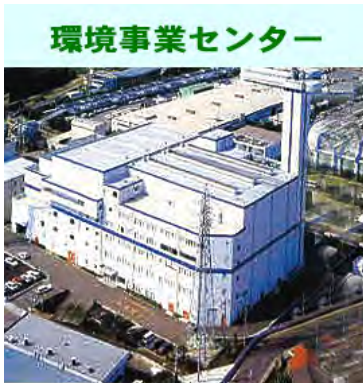
環境事業センター