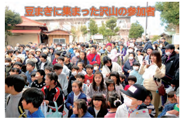
豆まきに集まった沢山の参加者