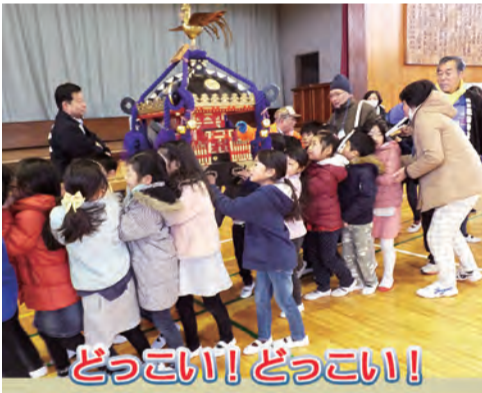
どっこい!どっこい!

●昔遊び 竹とんぼ・こま・お手玉・けん玉・おはじき・あやとり ●みこし体験 2月15日(金)、神輿ボランティア