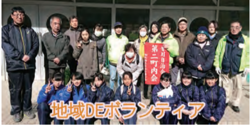
地域DEボランティア