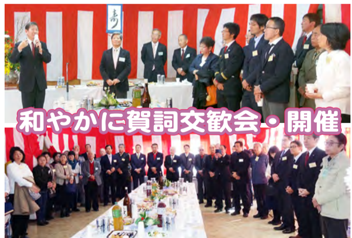
和やかに賀詞交歓会・開催

機体の起動、リヤカーの組み立てや防災用品の見学を行いました。また、生徒達とベタンク競技を行い笑顔で親睦が図られました。