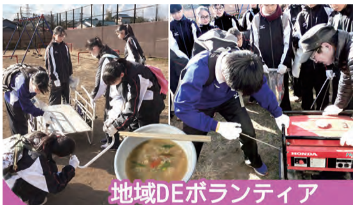
地域DEボランティア

1月26日(土)地域小・中学校の児童生徒を対象に、次の内容を目的とした活動が行われました。 ① ボランティア精神の向上 ② 地域の一員である意識の向上 ③ 地域の大人との交流 このイベントには、香川の第一・二・三・四町内会グループや甘沼、松風台、みずき自治会グループなどからスタッフを含めて244名が参加されました。 この日のために清掃活動の他、