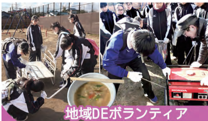
地域DEボランティア

地域の防災倉庫の見学と道具の使用、消火栓の位置や防犯施設の見学など、各グループにより色々な準備が進められました。 それぞれの集場所に参集した子どもたちは、この活動を支援する地域の方々の体験交流を通して、たくさんのお話を学び、またふれあうきっかけとなりました。 子どもたちの感想では「暖かい日差しと暖かい地域の皆さんと楽しく活動ができました。この後の温かい豚汁を楽しみにしています。」「ゴミが少ないことに驚きました。地域の皆さんのおかげだと思います。この状態を持続させることが私たちの使命だと思えます。」などが発表されて、活動の成果を実感できました。