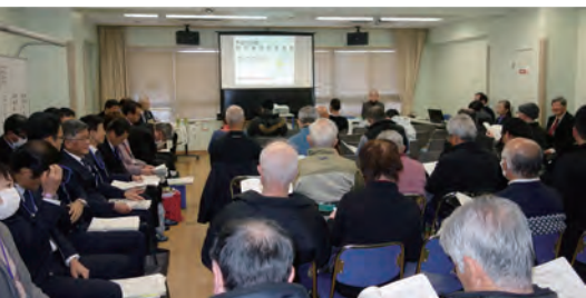
湘北地区市民集会の様子

当日の参加者は、香川、甘沼、鶴が台、一街区、みずき、ライトタウン、松風台、その他の参加者があり、行政からは市長ならびに担当の部長が出席しました。 会議は、事前に提出した湘北地区としての要望書に対し行政から回答とその説明があり、意見交換がなされました。 議事としては、①まちづくり問題 ②福祉 ③安全 ④教育 ⑤一般質問等の質疑が行われました。まちづくり問題の継続案件の最初に取り上げられている、松風台入り口の信号機周辺の朝と夕方における渋滞の解消については、交通量調査を平成30年度に行ったが、追加の用地取得は困難なため、既