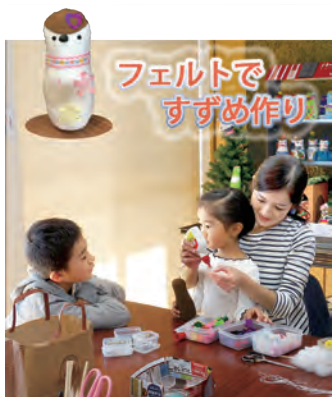
フェルトですずめ作り