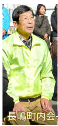
長嶋町内会長と女子生徒

その後香川小学校へ集合し、参加した学生のボランティア精神の向上および親睦が図られました。寒い中、役員、生徒の皆さんお疲れ