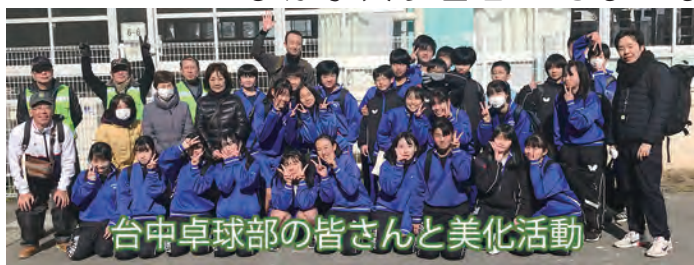
台中卓球部の皆さんと美化活動