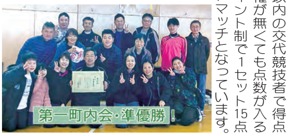
第一町内会・準優勝