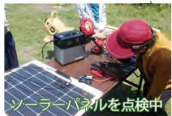
ソーラーパネルを点検中

○そして、お互いの顔が分かることそのものが安全安心、不安解消に繋がるんだらうなと改めて感じます。