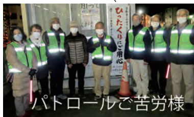
パトロールご苦労様

現在、第三町内会では月1回の防犯パトロールを実施しています。このパトロールは、陽が落ちた夕方から防犯灯や防犯カメラの点検を兼ねて町内役員、組長さん並びにボランティアの方々のご協力を得て実施しています。組長さんの参加をよろしくお願いいたします。 依然、コロナウイルス感染症が流行しています。引き続き、感染症予防対策の徹底をお願いします。 本年度も安心、安全な明るいまちづくりに努めてまいりますので、新たな組長さん並びに会員の皆様のご協力をお願いします。(亀井)