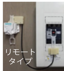
リモートタイプ 蓋付き配電盤にも

今年も、大地震(震度5以上)の際にブレーカーを遮断して、通電火災を防いでくれる「感震ブレーカー」の取付を行います。すでに各町内会には回覧がされています。機器の確認と申込みは「町内会の回覧」をご覧ください。