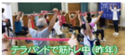
テラバンドで筋トレ中(昨年)