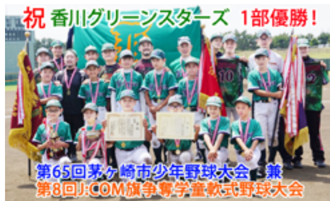
祝 香川グリーンスタース 1部優勝! 第65回茅ヶ崎市少年野球大会 兼 第8回J:COM旗争奪学童軟式野球大会

2022年5月5日(木)予選リーグを勝ち抜いた7チームでの決勝トーナメントで、若草野球部と決勝を戦い見事5対1で勝利、参加21チームの頂点となりました。1部での市大会の優勝は10年ぶりです。昨年6年生3人に5年生が加わり、6年生主体の他校チームと戦う中で経験を積み、6年生となった今期に早速結果を残してくれました。(ホームページより)