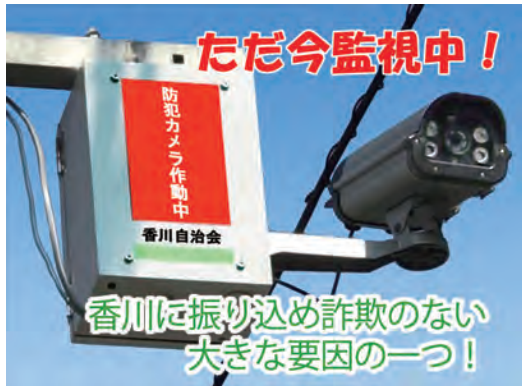
香川に振り込め詐欺のない大きな要因の一つ!

防犯部会は、防犯部員による防犯カメラの点検結果をもとに、月に一回稼働状況について、業者との定期メンテナンスの契約以降、自治会総務への報告を実施してい