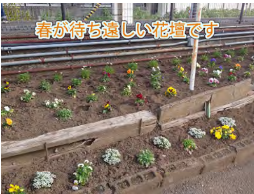
春が待ち遠しい花壇です

●スミレとパンジーのちがいは？ ◇スミレ・日本原産の植物で、女 性の名前にも使われるくらい可愛 らしい草花です。 ◇パンジー・スミレを園芸用品 種改良した花で三色スミレと呼ば れることがあります。