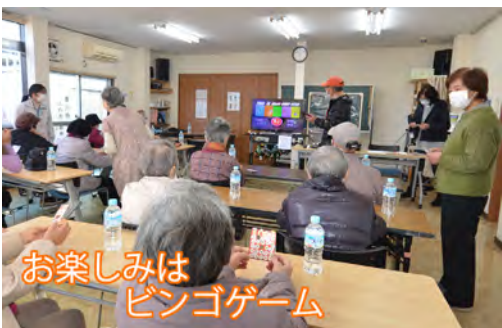
お楽しみはビンゴゲーム

おたのしみ会は、香川地域に在住の「70歳以上で一人住まい」「日中1人になる方」などを対象に、民生委員が声掛けをして、ミニデイスーパー（交流の場、ふれあいの場）を提供しています。 コロナ禍の中、感染予防対策を行いながら、12月19日（月）香川自治会館で開催しました。 参加の方々には、定刻までに自治会館に来館していただき、保健師さんによる血圧測定のほか、体操やビンゴゲームなどを行い、楽しく過ごして頂きました。 何よりも元気で参加してくださった皆様の笑顔にスタッフ一同感謝です。ありがとうございました。 ●お楽しみ会 開催日