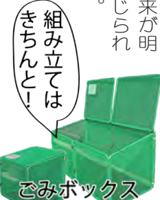
組み立てはきちんとして! ごみボックス

『カラスは可愛そうなんだよ。人間が食べ物を無駄にして捨てるから、カラスが町に住みついているだけ人間が悪いんだよ、カラスは山で食事をして、山で家族と暮らしていたのに』 と言われました。