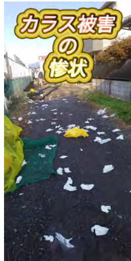
カラス被害の惨状