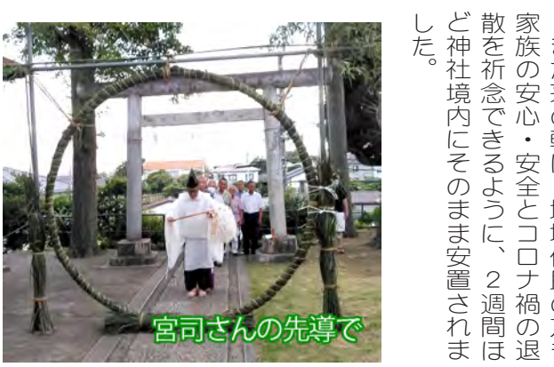
宮司さんの先導で

資源回収推進地域補助金 香川自治会として、資源回収推進地域補助金(1月～6月分)約60万円を受け取りました。資源物の分別回収にご協力をありがとうございました。