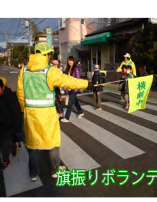
旗振りボランティア