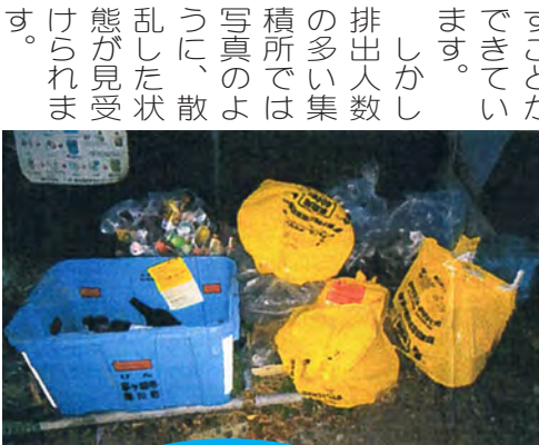
分別すればごみも資源に！

自分一人だけなら大丈夫と思わず、集積所を気持ちよく、綺麗な状態に維持するために、利用するみなで分別・排出マナーを守っていただきたいと思います。