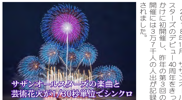
サザンオールスターズの楽曲と芸術花火が1/30秒単位でシンクロ

サザンビーチがさきで、サザンオールスターズの楽曲と世界最高峰の花火がシンクロし、夜空を彩る、国内最大級の芸術花火イベント「茅ヶ崎サザン芸術花火」です。