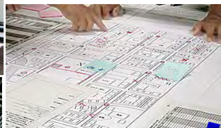
イメージTEN 自主防災組織の災害対応を検討