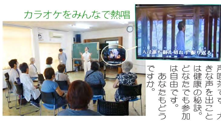
カラオケをみんなで熱唱

歌のひろばは、毎月第4木曜日午後1時～3時、香川自治会館に集い、カラオケに合わせて楽しく歌うボランティア主催のサークルで、曲目は参加者のリクエストで決まります。まさに昔懐かし歌声喫茶です。大きな声を出して健康の秘訣。どなたでも参加は自由です。あなたもどうぞか。