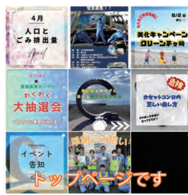
4月 人口とごみ排出量 April 大抽選会 イベント告知 トップページです

茅ヶ崎市環境事業センターは、ごみ及び資源物の問題に関する有益な情報や、環境事業センターの取り組みをより多くの市民に伝達するため、Instagram(アカウン ト名: @chigasaki-packer)を展開しています。興味のある方は、フォローされてはいかがでしょうか。