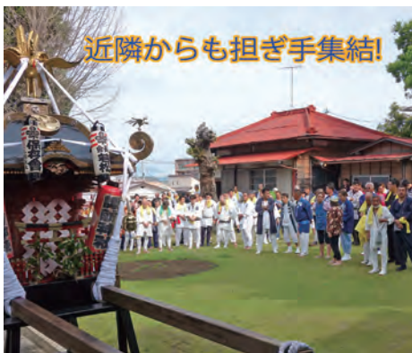
近隣からも担ぎ手集結!

8時の宮立ちには200名以上の担ぎ手が参集。威勢の良いかけ声と共に、香川公民館から相模線の踏切を越え、ゆうゆう公園で昼食をとり、香川駅を經由して午後12時無事入りとなりました。