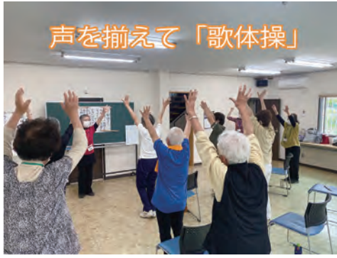
声を揃えて「歌体操」

4月より自治会館での講座が再開されましたが、人気の講座のため募集人員を超え、現在はキャンセル待ちの状況です。