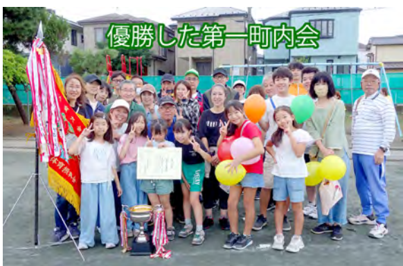
優勝した第一町内会

発行 香川自治会広報部会 香川の人口 11,794人 男性 5,852人 女性 5,942人 世帯数 5,062戸 2024.10.1現在