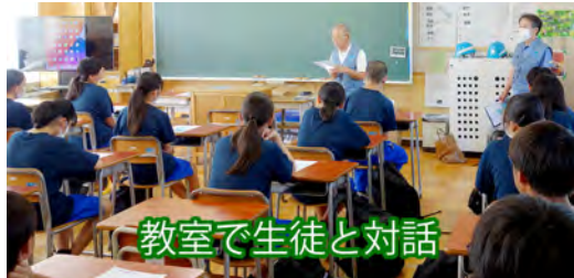
教室で生徒と対話

昨年(2023)に続き、今年も鶴が台中学校が計画の9月7日「地域と協同して行う防災学習会」に対し、生徒の居住する各自治会に協力の要請があり、対応しました。 当日は、午後1時より、自治会毎に所定の教室に向き、オンラインによる災害時における行動について防災対策課の講師による講話を生徒と共に視聴し