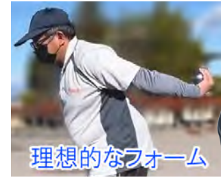
理想的なフォーム