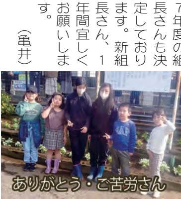
ありがとうございます・ご苦労さん

くの町内会員の参加をいただきました。今回はたくさんさんのペットボトルを回収いたしました。なかなかゴミの投げ捨てがなくならず、残念です。 12月8日に開催されましたペタンク交流会・選考会では第三町内会より参加した2チームが昨年度に引き続き優勝、準優勝を獲りました。おめでとうございます。 2月に開催される茅ヶ崎市の大会での活躍を期待します。 本年度も残り2か月となりました。昨年12月に依頼しました令和7年度の組長さんも決定しております。新組長さん、1年間宜しくお願ひします。 (亀井)