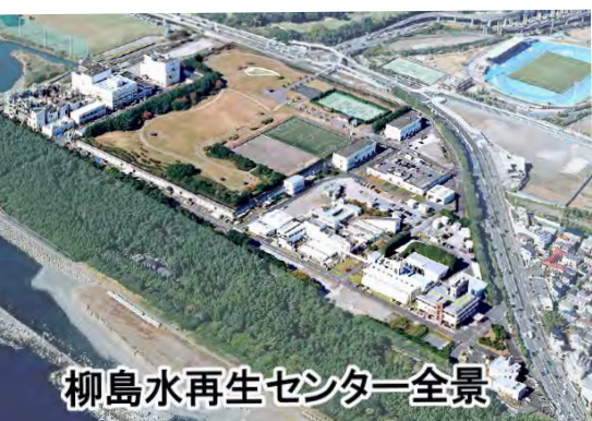
柳島水再生センター全景

下水をきれいに処理し、海に放流するまでの水処理の工程に沿って施設を見学しました。