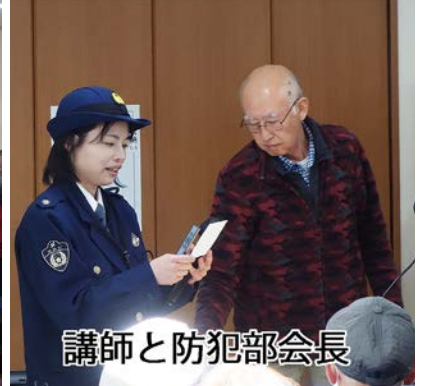
講師と防犯部会長