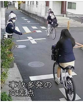
多発の事故 交差点