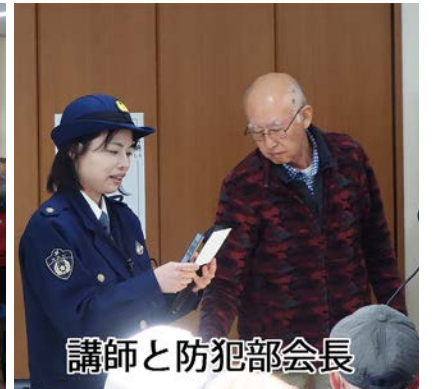
講師と防犯部会長