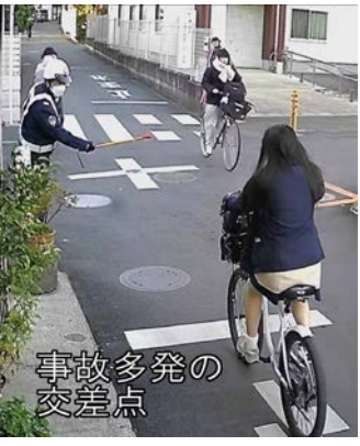
多発の事故 交差点

令和8年度スタートしました。43号でお知らせしたとおり集積所にあるポスター、特にごみと資源物のカレンダーは、3月中旬にパウチをして張替えを済ませました。皆さんのお手元にも届いていることと思います。収集日を確認して各指定場所に出してください。そして、令和8年度の「ごみと資源物の分け方・出し方」の冊子も届いていることと思います。毎年お手元に届くので中身が変わっていないように思えますが、環境事業センターは都度見やすいように