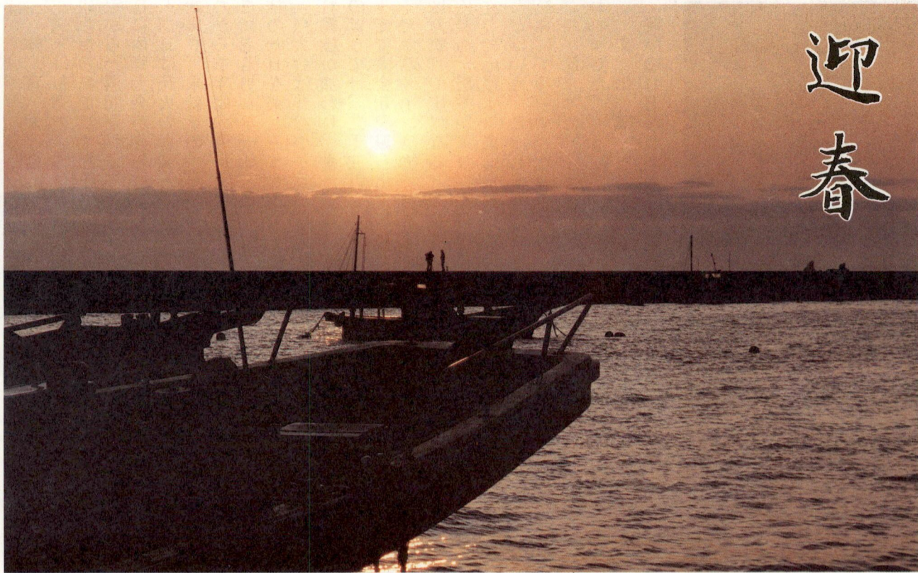
今年こそは未来に向かって明るい展望が拓かれるように期待して、初日の出を茅ヶ崎海岸で撮影(広報委員 春日)