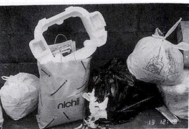
(上) ネットのかけられたゴミ袋 (下) 袋をくい破られ散乱したゴミ