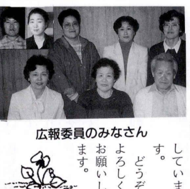
広報委員のみなさん