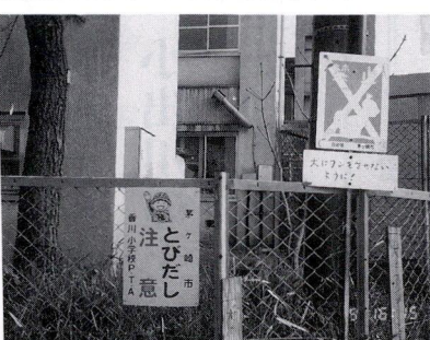
安全よびかけの看板

防犯灯やカーブミラー、ゴミのすっきりと安全を呼びかけています。地域の中でも大事に守って頂ければうれしいです。