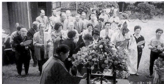
浄心寺の花まつり

お釈迦様のお誕生を祝っての行事は、八日に行われるのが一般的ですが、九日は浄心寺の題目会に当るので、この日に行われたのです。