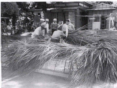
茅の輪作りに励む 神社役員の方たち

組長さんや気のついた方は、電柱についている番号をみて、すぐに指定の電気店に連絡して、直してもらいましょう。 痴漢や交通事故などの被害をうけないように、事前に注意することが大切だと思います。