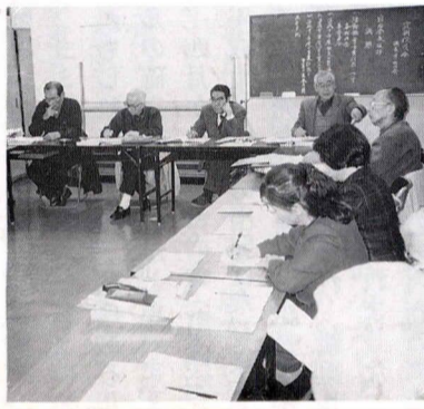
自治会定例役員会