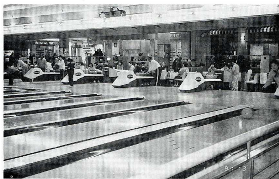
寒川セントラルボーリング場

二ゲームも終りに近づき、誰がハイスコアを出しているとか、誰とは何ピン差だとかが聞こえてくると、熱戦も終わりとなりました。