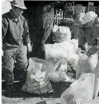
美化キャンペーン

ゴミ問題は永遠の課題といえるかもいれませんが、秩序あるルールの確立が第一歩かと思ひます。四月からは、自治会(町内会)も平成十一年度の出発になります。それに先んじて新しい組長さんの選出が二月に行なわれ、新組長会が二十八日に開催されました。また、新年度の町内会の事業や予算を検討するための、町内会役員会が二月二十一日に開催されました。