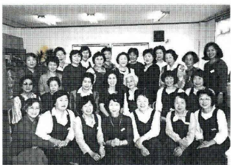
エプロンドレスの婦人会メンバー

自治会の行事への参加、協力、会員相互の親睦、知識の向上を通して老後の人生を豊かにする為に活動をしています。