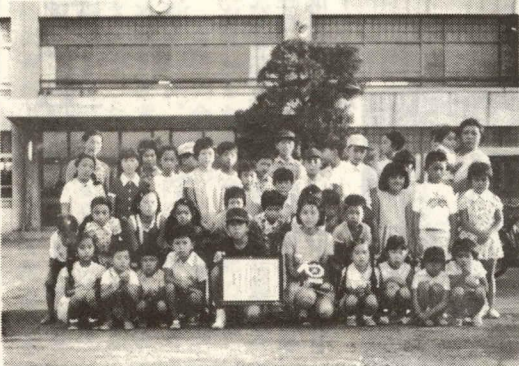
地域こども会として発足以来、活発な活動を展開し、特に近年は清

八月二十七日(金)十時から横浜の県立青少年センターで、優良こども会の表彰が行われた。