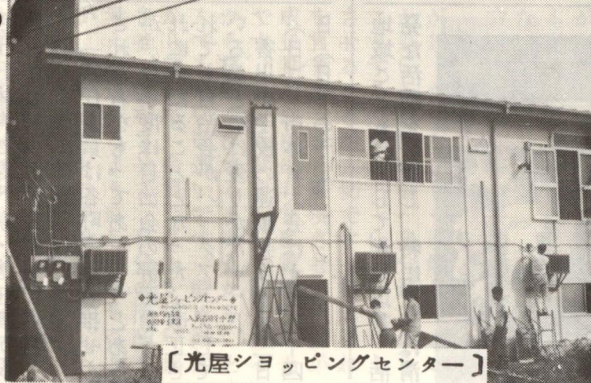
【光屋ショッピングセンター】

ても日用品が買えるようになるし、住民はたいへん便利になるので完成が待たれている。開店は、九月下旬の予定。