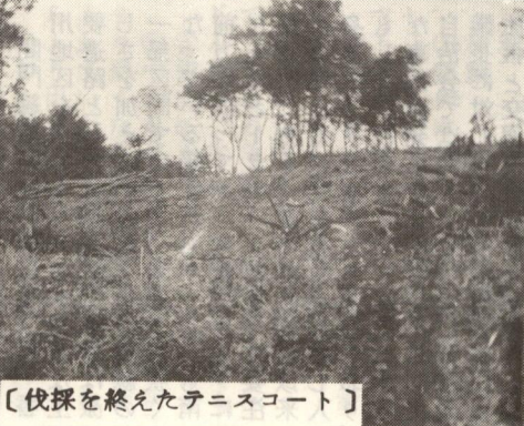
【伐採を終えたテニスコート】

だけという事情からテニス本来の目的であるスポーツを通じての友情、家族の社交の場、青少年の大きな問題である家族ぐるみのいこの場等からみまますと、公営のコートではそれを満たすことは出来なと思われまして。ここで現在テナスコートとして成り立っているコート面数をみますと、公営以外では神奈川県下にはわずか二十面にも満たないコートが湘南地方を中心として各地に点在しているのが実情であります。人口の二倍が潜在的競技人口とみなされるテニスを思うと実に寒々しい現状であります。この窮状を少しでも打開できればと考え、湘南の茅ヶ崎のグリーンランドゴルフ場の並びにある丘陵約二二〇〇〇平方メートルを開発し、日本では類を見ない本格的なテニスコート建設に着手いたしました。あくまでも緑を主体とし、自然に囲まれた中に十三面のコート、クラブハウス、プール、子供の遊び場等、社交の場にふさわしいテナスコートを念願として、来年四月オープンを目ざしてまい進中であります」