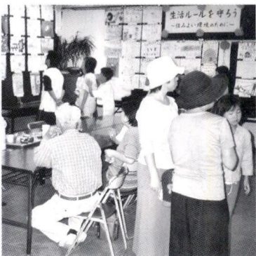
ポスター展会場風景

平成14年9月28日(土)・29日(日)香川自治会館に於いてポスター展が開催されました。今年のテーマは「生活ルールを守ろう」とサブテーマとして「住みよい環境のために」で空缶・ボトル・タバコすいがら・ゴミ・のポイ捨て・犬のふん放置・落書き・等々を道路から無くしましょうということを書いてもらいました。出品数は27点でした。もっと多くの人達に見て頂きたいと思えますので来年も宜しくお願いします。