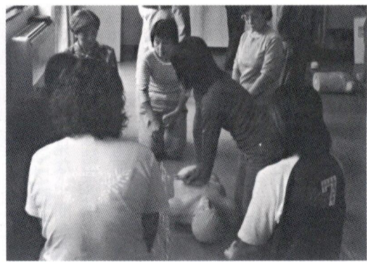
救命救急講習会より