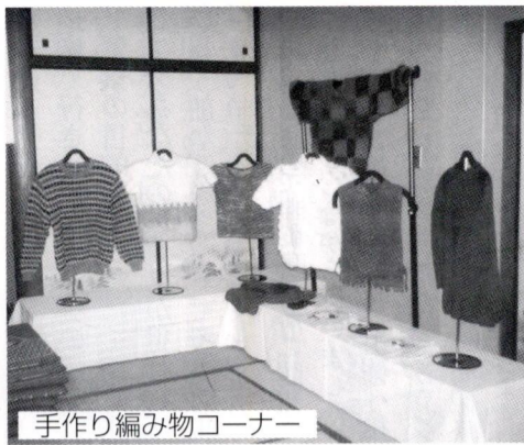
手作り編み物コーナー