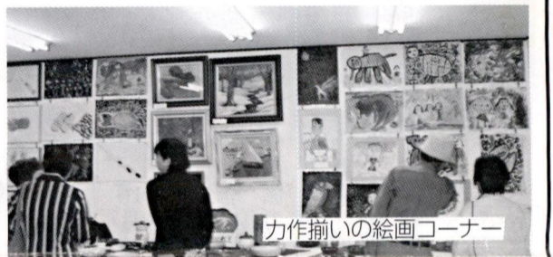
力作揃いの絵画コーナー

また文化祭に出品されたこの方は是非来年度出品して下さい。役員の皆様お疲れ様でした。