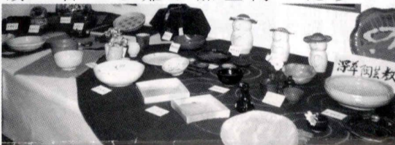
これら単に香川自治会が...

この度自治会の方々始め、香川公民館当教室に通って来て下さっている生徒さんのおかげ様で、念願叶って香川の地元で陶芸教室を10月にオープンさせていたいただきました。 5年前に1人で文化祭に参加させていたの期に、今年自治会陶芸クラブ当教室で、30名の参加者が出品しました。本当に有難うございました。