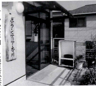
ボランティア香川正面玄関入口

一九九六年四月に発足以来活動を続けてきた当会は、地元香川に念願の拠点を持つことができ、本年度の活動を開始しました。