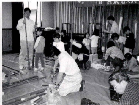
自由木工、竹馬づくりの親子