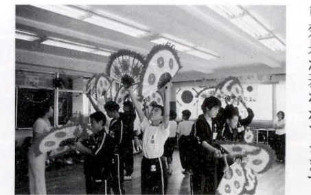
老廃物を少しずつ自然な形で排出していきます。継続する事によって、必ず体に良い効果が表われてきます。ゆっくりと無理のない動作を繰り返して汗をかき、体の柔らかさを取り戻していきま

朝刊の折込みずしり菜種梅雨谷戸の風類にべたつく椎若葉 眼目は中七の「類にべたつく」でしょう。この率直な皮膚感覚