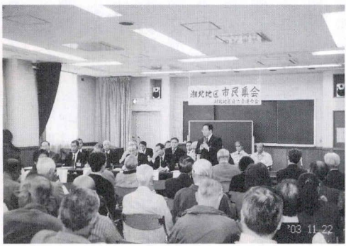
03 11 22