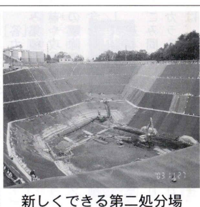
新しくできる第二処分場

以上の感想を取記してみました。今回は21名参加した中で16名が初めて参加されました。