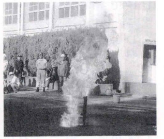
天ぶら油に水を入れた瞬間

最後に炊きだし訓練の成果、非常食のトン汁を皆んなで頂き解散となりました。来年は会員の皆さま