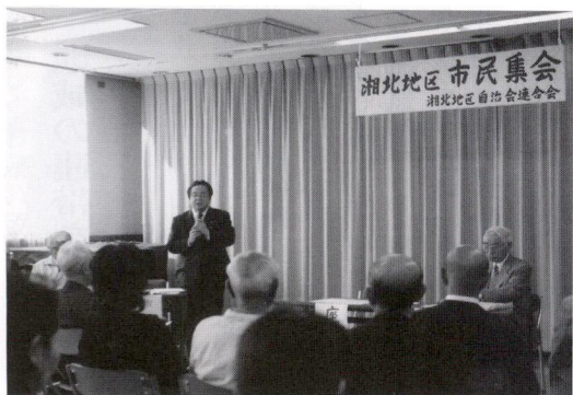
茅ヶ崎市長のご挨拶

集会は、資料として事前に作成された「市民の市政に関する質問及び要望と回答」をベースに、更に当日の出席者からの質問に対する回答と云う形で進められました。