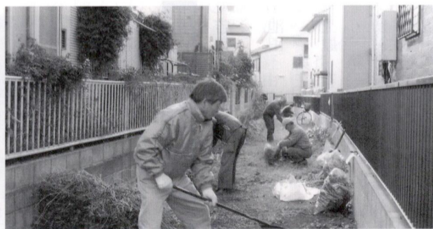
有志による清掃作業