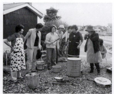
ドラム缶陶芸の様子

昨年の10月、はじめて地元閑居山で当教室の陶芸展を開催しました。当日は地元の方々をはじめ多くの方々において戴き、その数180名余り。本当に有り難うございました。