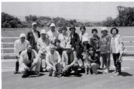
見学会参加の皆さん