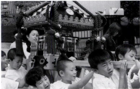
子どももがんばった