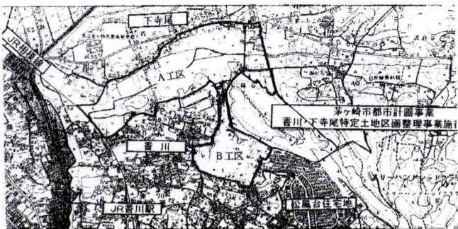
香川下寺尾特定土地区画整理区域