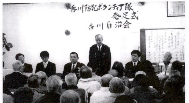
2月11日ボランティア隊発足式 畔柳茅ヶ崎警察署長の挨拶