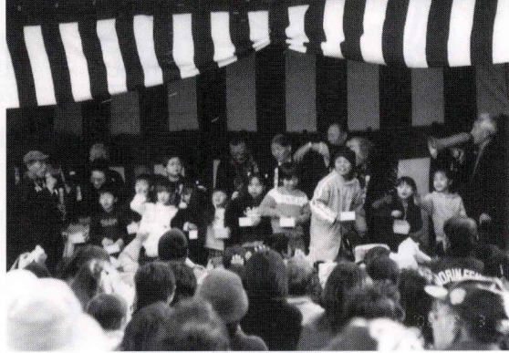
子どもと一緒に 福は内!

二月三日、諏訪神社の境内で行われた「節分祭」には、黄色い帽子を被った可愛い幼稚園児から熟年?の皆さんまでおよそ二〇〇名の人々が集まりました。 豆まきが始まる予定の午後三時を過ぎると子供たちは待ちきれずに「まだか?まだか?」と豆まきを催促。本殿で行われた宮司の念入りな?お払いに少々時間が掛かったようです。やっとう舞台上に役者?が勢ぞろいして豆まきが始まりました。福はうち、鬼は外! 最初は「チビッ子年男」が元気に豆をまき、続いて香川商興会からお菓子や引換券の入った福袋が撒かれると、子供たちに負けず?大人も大騒ぎでした。 昔は、立春の前日(節分)の夕暮れ時に、柊の枝にいわしの頭を