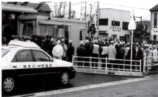
2月16日「さくらハウス」前にてボランティア隊パトロール

最後に、香川自治会まちづくり委員長の力強い決意表明があり、その後各町内会ごとにデモンストラーションの防犯パトロールを実施してお開きとなりました。