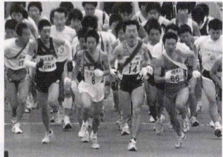
男子一斉スタート