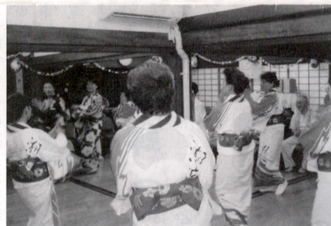
「あんのん」での夏まつり

去る8月5日（土）香川北部にあるデイサービス「あんのん」よりレディース香川に対し夏祭りの盆踊りへの要請がありました。どのような場所でも踊るのを見せ、参加する会員を募って十一名が参加しました。「利用される高齢者の方が喜ばれるものだから」と言うのが主旨で、炭坑節をはじめ4曲踊って参りました。「あんのん」では松風台の「フラダンス」、香川公民館サークルの「大正琴」、「マジックショー」、「南京玉すだれ」等々盛沢山のプログラムが組まれていて、初めての参加に喜ばれました。※半年経過した現在では、延べ100名の方が利用されているようです。スタッフ17名で一人一人に添ったケアを目指し頑張っていますとの事でした。レディース香川は、他にも今年8月12日（土）特別養護老人ホーム「カトレア」へ、又8月19日（土）には新北陵病院の夏祭りに参加しました。同日松風台自治会