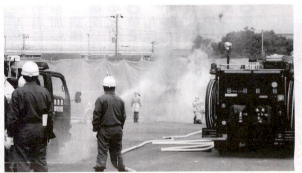
消防隊による消火訓練

防災組織は地域の総合力です。機会がありましたら、是非一人でも多くの方々に訓練を経験して頂き、いざと言う時には地域の総合力として発揮して頂ければと思います。(IS)