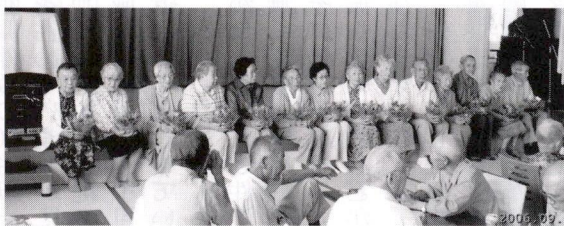
花かごをうけられた皆さん

香川自治会主催の敬老大会が今年も9月3日(日)に茅ヶ崎市老人福祉センターで開催されました。参加された先輩諸兄(70歳以上)は81名。その中で米寿(88歳)を迎えられたお元気な方が14名も参加されました。実にうれしいことです。