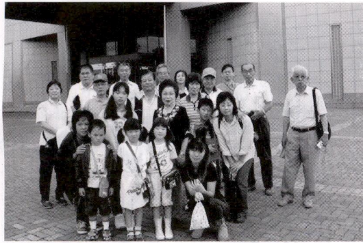
防災センター見学

有意義な参加体験型の『自転車ルール講習会』は、3時間弱で終了したが、一緒に参加した妻の感想は、気軽に便利な自転車を毎日利用している「自己流のルール」で反省!これを機会に『お互いゆづり合い、思いやりの心を忘れず運動マナー・モラル・そしてルールを守る』を心掛けていきたいと思う。