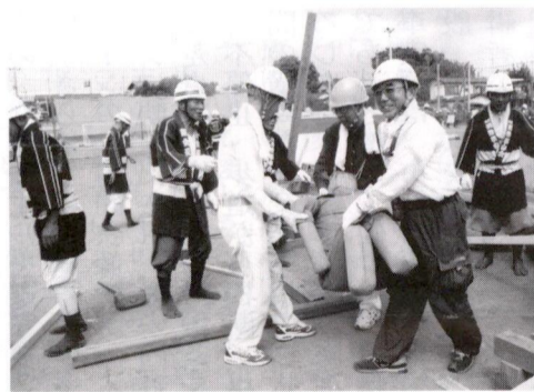
負傷者の救出訓練

その背景には、救護者と支援者と言う届出制度に躊躇しておられる方も少なくないと思います。災害発生時には有効な制度ではあります。折角の制度であり活用しませんが、時と場合によっては逆の立場に立たされることも考えられます。折角の制度であり活用しませんが、時と場合によっては逆の立場に立たされることも考えられます。