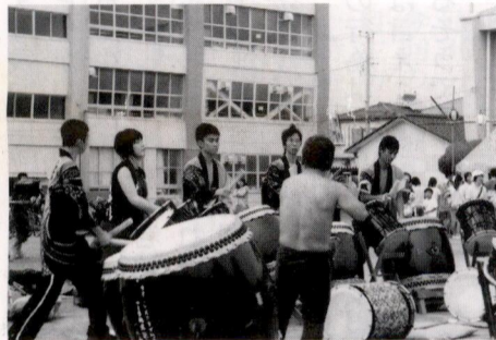
初参加 平塚ろう学校の皆さん

終つてから二ヶ月、皆様の脳裏から消え去っていることと思えます。「ふれあいまつり」も八回目となり、会場が香川小学校に移つてから三回目でした。さて、その裏側はどうなっているでしょうか。「ふれあいまつり」開催に当たっては、実に多くの関係者の支援、協力があります。市役所（公民館舎）、教育委員会、警察、香川小