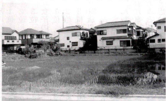
香川で唯一となった田んぼ