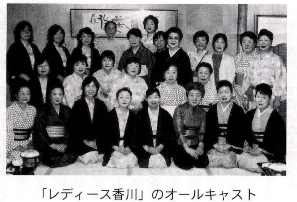
「レディース香川」のオールキャスト

いま、茅ヶ崎市では市内全域を対象にした水害に対する防災ハザードマップの作成が検討されています。一般に「防災」と言いますと地震を中心とした対策が行われていますが、昨今の温暖化による気象変動の影響でアフリカでは早魃が、北米ではハリケーンの巨大化による集中豪雨など世界各地で被害が発生しています。つい最近も隣中国では旧正月の前後に長雨による交通の混乱や河川の氾濫などが発生し、大きな被害を及ぼしていたことは新聞等でご存知の通りです。