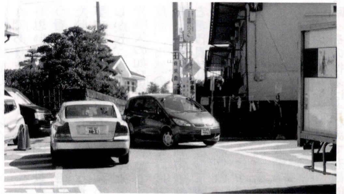
早期解決が望まれる道路整備

②仲通りの側溝暗渠化について 香川4丁目11番先から西久保変電所前に至る仲通りは、道路脇の側溝の存在で道幅が狭く、車が自由にすれ違うことができない状況であり、行政に対して早期に側溝の暗渠化を求めてきましたが、この度、行政側から、隣接する地権者との話し合いの上20年度中には暗渠化を実施したいとの回答を頂きました。最近車の往来が激しくなる中、早期に改善されること期待されます。 ③香川駅前交番設置について 香川住民の長年にわたる要望事項ですが、神奈川県長会での情報ですと、神奈川県内だけで交番設置要望箇所は26箇所(茅ヶ崎市内では3箇所)ある。その一方で県内では犯罪の増加や交通事故が多発する地域も多く、現時点ではそちらが優先される。従って「現段階では香川駅前への交番設置は困難である」との回答でした。 ④香川小学校通りの拡幅計画(本件は2月14日の行政側からの説明) 長い間懸案事項となっていました。香川1丁目の「イサミ屋酒店」横から香川小学校入口信号までの道路整備について、周辺住民の皆さんに対する説明会を開催後、平成20年度より3期に分けて15年計画で拡幅工事が行われることになりました。 以上、少ない時間内での説明会でしたが、行政に対しては今後も頻度を上げて説明会を開催して頂き、その進捗状況を粘り強く注視してゆくことが重要かと思えます。