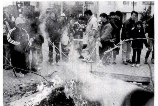
寒い中の暖かい火

小正月の1月14日、第4町内会が中心となって隣接するみずき4丁目の「みずき公園」で北町道祖神の「どんど焼き」が行われました。当日は日差しが無くやや肌寒い