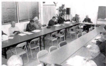
討議中の評議委員会

②仲通りの側溝暗渠化について 香川4丁目11番先から西久保変電所前に至る仲通りは、道路脇の側溝の存在で道幅が狭く、車が自由にすれ違うことができない状況であり、行政に対して早期に側溝の暗渠化を求めてきましたが、この度、行政側から、隣接する地権者との話し合いの上20年度中には暗渠化を実施したいとの回答を頂きました。最近車の往来が激しくなる中、早期に改善されること期待されます。 ③香川駅前交番設置について 香川住民の長年にわたる要望事項ですが、神奈川県長会での情報ですと、神奈川県内だけで交番設置要望箇所は26箇所(茅ヶ崎市内では3箇所)ある。その一方で県内では犯罪の増加や交通事故が多発する地域も多く、現時点ではそちらが優先される。従って「現段階では香川駅前への交番設置は困難である」との回答でした。 ④香川小学校通りの拡幅計画(本件は2月14日の行政側からの説明) 長い間懸案事項となっていました。香川1丁目の「イサミ屋酒店」横から香川小学校入口信号までの道路整備について、周辺住民の皆さんに対する説明会を開催後、平成20年度より3期に分けて15年計画で拡幅工事が行われることになりました。 以上、少ない時間内での説明会でしたが、行政に対しては今後も頻度を上げて説明会を開催して頂き、その進捗状況を粘り強く注視してゆくことが重要かと思えます。