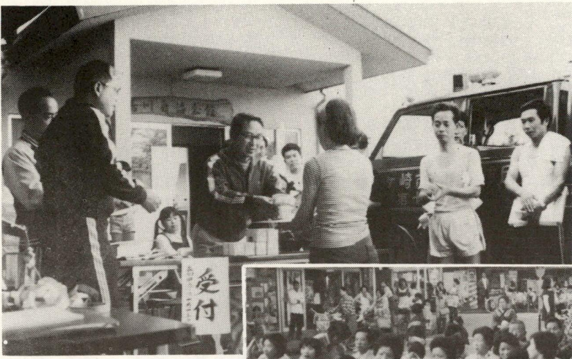
町内一周マラソン大会表彰式 駅前広場の演芸会場

住みよい地域づくりのための対話と研究の場として、住民の汗と熱意でつくられた香川自治会館。年間利用者延三万人。今後のより有意義な利用が期待されます。