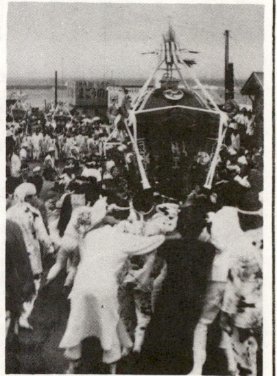
県無形民俗文化財に指定されている(フジテレビ放送の日本の祭りにも出演しました。8/15~17日)