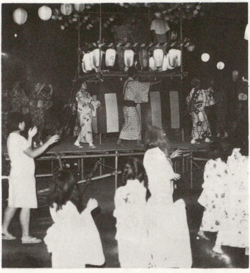
8月14、15、16日恒例の香川地区の盆踊りが盛大に行われました。今年はやぐらのまわりに舞台を作り踊りがわかりやすいようになっていました。種々の燈ろうが並び見事な夏祭りでした。

本年度第一回の子ども映画会当日は蒸し風呂の中のような暑さ、係の方もちびっ子観客も暑さもなんのその、みな一生懸命取り組み鑑賞していた。「こんぎつね」「人魚め」の二本立でした。