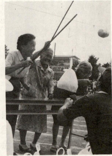
宝つりゲームをたのしむおばあちゃん

盛大に行われる!! 九月十五日、香川小学校の校庭はあふれるばかりの人でうづまり、応援の声々で大いに賑わいました。延参加人員二七四三名と大盛況のうちに終わりました。 町内対抗種目総合得点 優勝 松風台 四三・五 二位 第二町内会 三九・五 三位 第四町内会 三九・五 四位 第三町内会 三八・五 五位 第一町内会 三七・五 六位 甘沼 二六・五 年代別町内対抗リレー