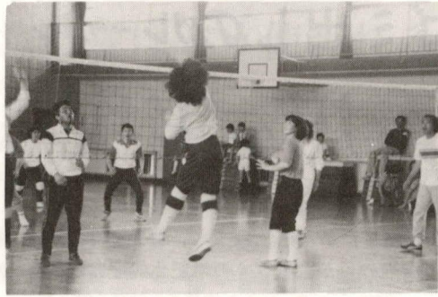
町内対抗バレーボール大会

5月26日、香川小学校体育館で、町内対抗バレーボール大会が行われました。大勢のパバさん、ママさんが参加して、熱戦がくりひろげられましたが、第一町内会が二年連続して優勝を勝ちとりました。成績は次の通りです。 優勝 第一町内会(連続) 二位 第三町内会 三位 甘沼自治会 四位 第二町内会 五位 松風台町内会 六位 第四町内会