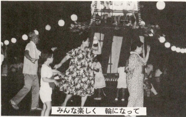
みんな楽しく 輪になって

八月の楽しい行事のひとつ、盆おどり大会が、十四日(水)から四日間、第一青少年広場で行われました。四日間とも天候に恵まれ楽しいおどりの輪が、広場一杯に広がりました。会場の中央には、太鼓や商興会の色とりどりの提灯は、大会の雰囲気を一層盛り上げました。盆踊り愛好会、商興会、祭囃子保存会、子供会、婦人会、体育振興会として近所の皆さま、その他大勢の皆さまのご協力、どうもありがとうございました。