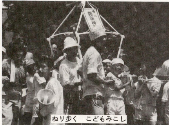
ねり歩く 子どもみこし

八月の楽しい行事のひとつ、盆おどり大会が、十四日(水)から四日間、第一青少年広場で行われました。四日間とも天候に恵まれ楽しいおどりの輪が、広場一杯に広がりました。会場の中央には、太鼓や商興会の色とりどりの提灯は、大会の雰囲気を一層盛り上げました。盆踊り愛好会、商興会、祭囃子保存会、子供会、婦人会、体育振興会として近所の皆さま、その他大勢の皆さまのご協力、どうもありがとうございました。