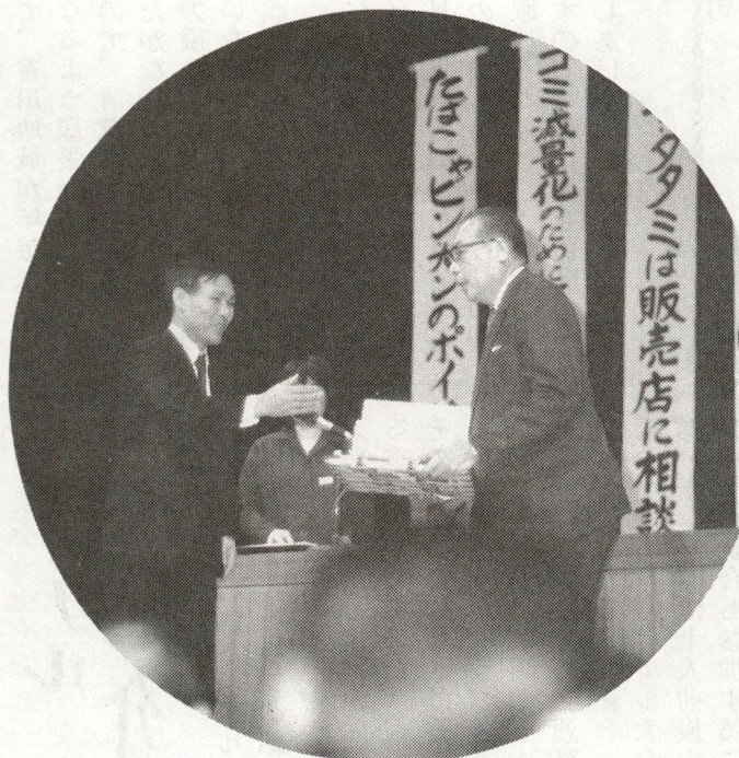
香川自治会表彰される