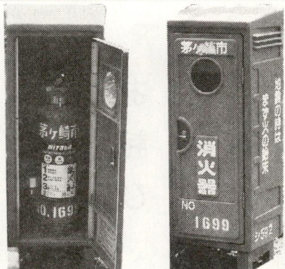
街頭消火器 香川地区六ヶ所設置

つぎに防災無線広報ですが、毎日午後五時にスピーカーからチャイムが流れています。地震の警戒宣言が出された場合はサイレンが三回鳴り市長が注意放送します。その時は窓を開き、又は屋外に出て聞いて下さい。そして皆様は各町内の避難場所に避難して下さい。その他緊急にお知らせする必要がある場合は震度四以上の地震、津波警報、光化学スモック、などがあります。放送をよく聞いて下さい。